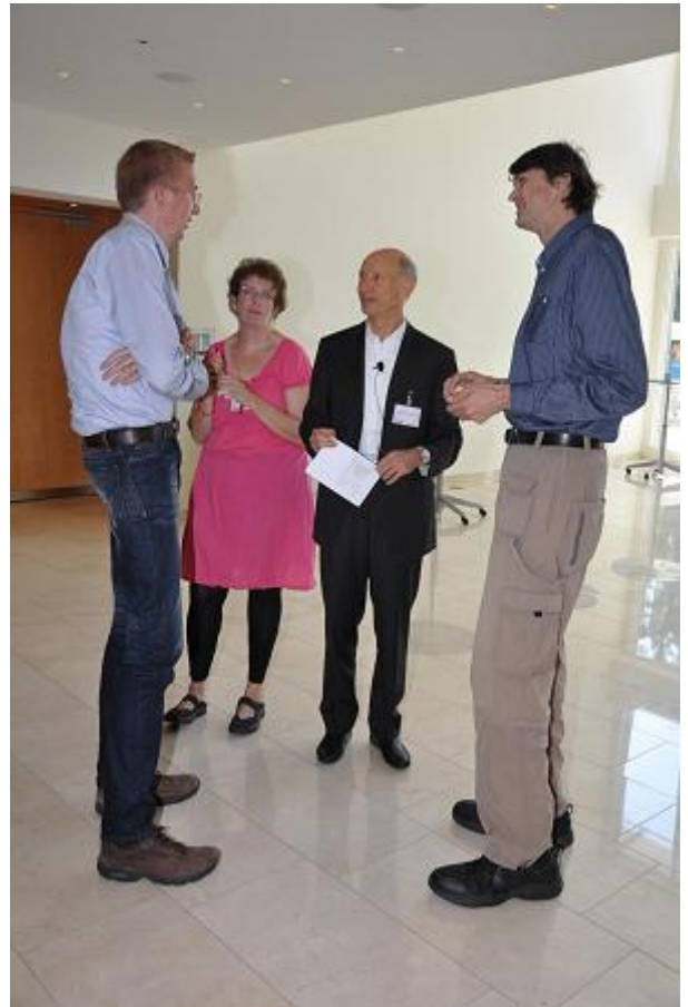
Delegerede fra Danmark, Norge, Schweiz

Det næste europæiske møde bliver i Sverige i 2015. Men allerede næste år håber vi at mødes med de andre europæiske foreninger til Marfan Symposium i Paris september 2014, hvor der igen samles specialister fra hele verden.